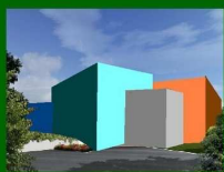
vista sud - accesso dal parcheggio

Intervento cofinanziato con DGR n. xx/xxxx