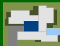
prospettiva distribuzione interna