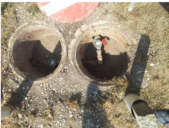
Ubicazione della concessione. Area del pozzo geotermico e pozzetti dei contatori.