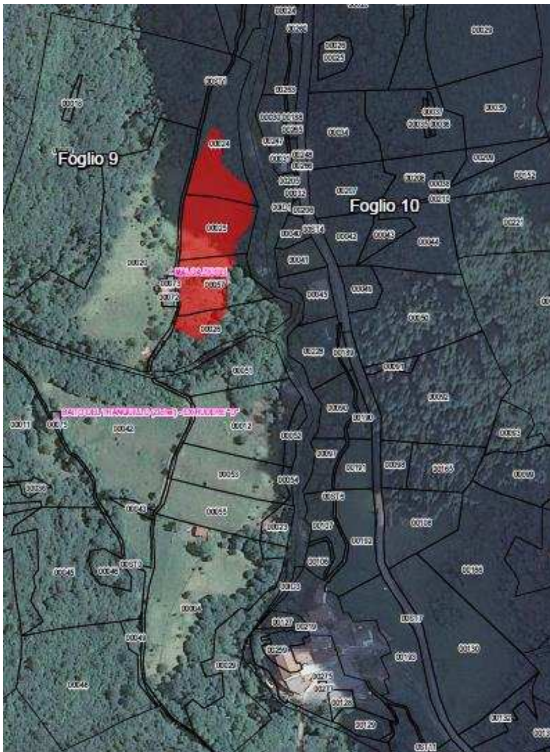
Corpo fondiario 1 Boscangrove-Zicoli