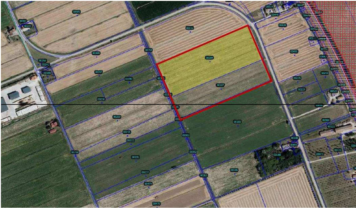
COMUNE TAGLIO DI PO FG 8 M.N. 184-327