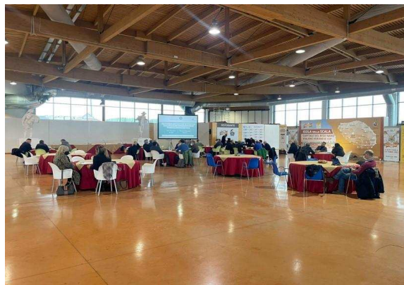
Isola della Scala (VR)

Si invita infine a riflettere sul rapporto tra ATS e Unioni , per organizzare una piramide amministrativa priva di duplicazioni o "zone grigie" in tema di funzioni, programmazione, erogazione servizi. Più in generale, si invita a riflettere alla nuova architettura istituzionale della Regione, che dovrebbe articolarsi in Regione, Province, ATS, eventuali subambiti, Unioni, Comuni.