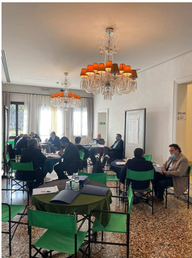
Montegrotto Terme (PD)

Nei confronti della Regione, l'aspettativa è che gli ambiti abbiano una chiara definizione giuridica , alla quale far corrispondere un referente regionale, e all'interno degli ambiti stessi, professionalità e competenze; che vengano attivati interventi normativi, percorsi di formazione, favorite le attività di concertazione tra territori e messe a disposizione delle risorse, anche promuovendo bandi che diano priorità ai Comuni che rispettano i requisiti definiti per l'ambito.