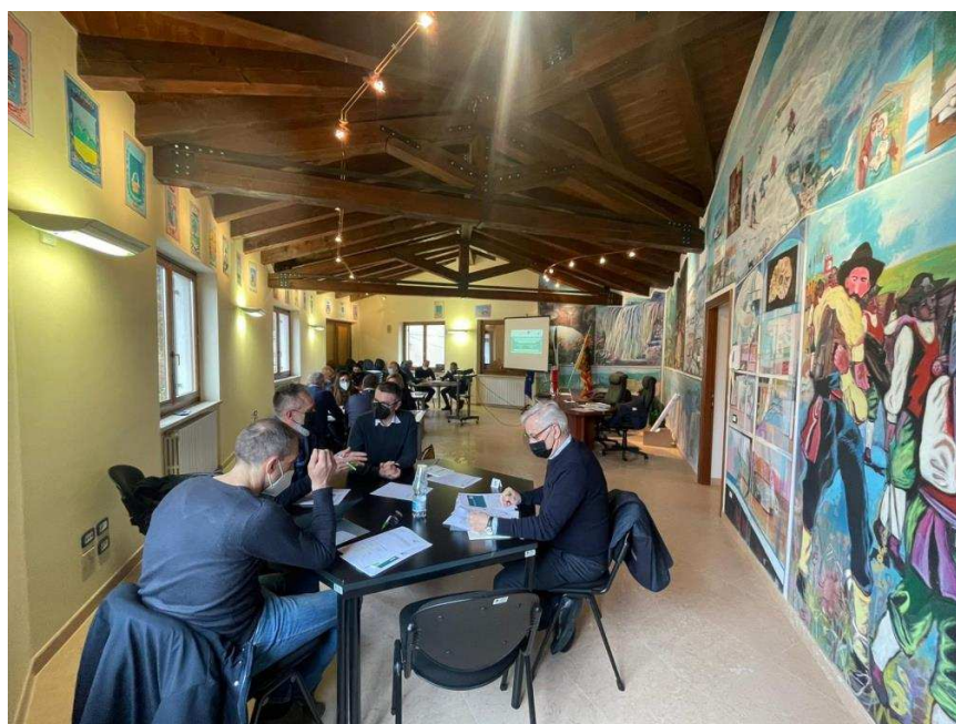
Bosco Chiesanuova (VR)

Per ciascuna area tematica si riporta una mappatura di tutte le posizioni emerse, con attenzione a riportare in modo pesato quelle maggiormente condivise dai partecipanti.