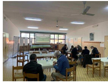
Galzignano Terme (PD)