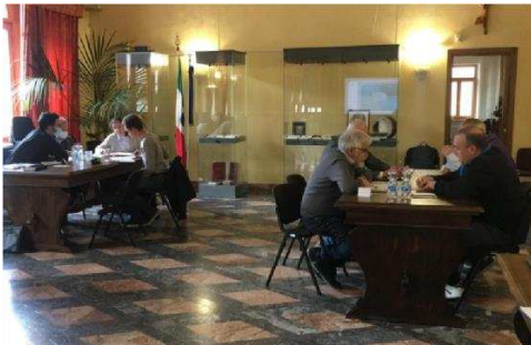
Pieve di Cadore (BL)