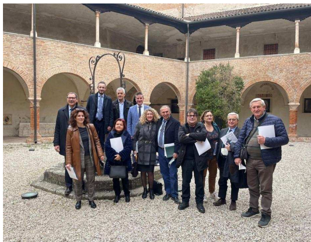
Badia Polesine (RO)

La Provincia potrebbe essere il livello idoneo per posizionare funzioni sovracomunali o deleghe regionali. Pensate che la Provincia possa essere il livello idoneo per la gestione di funzioni sovracomunali ad alta professionalità? (ad es. CUC, politiche UE, Avvocatura, Procedure concorsuali, Sistema Informativo e banche dati)? Siete d'accordo sul fatto che ci possa essere una gestione in ambito provinciale di determinate deleghe regionali?