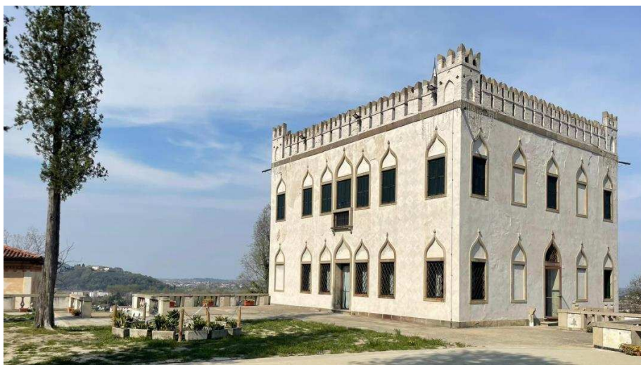
Montegrotto Terme (PD)

Ogni partecipante ha ricevuto una cartellina con materiale informativo utile allo svolgimento delle attività. Durante gli incontri sono stati organizzate pause caffè.