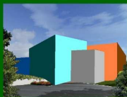
vista sud - accesso dal parcheggio

Intervento cofinanziato con DGR n. 2496/2014