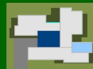
prospettiva distribuzione interni