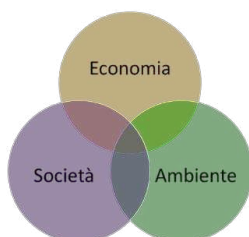
Figura 2: i tre pilastri della sostenibilità: economica, sociale ed ambientale.

Sostenibilità: capacità di mantenere la continuità a lungo termine dell'ambiente e delle attività umane nei loro aspetti socio-economici, istituzionali, ambientali e produttivi (vedi standard SR-10 di IQNet).