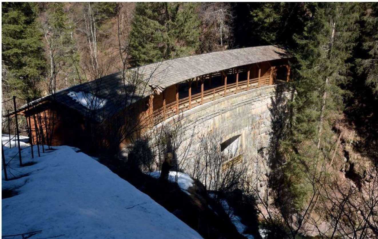
60. Vista della Stua di Padola sul torrente Padola (Comelico Superiore).