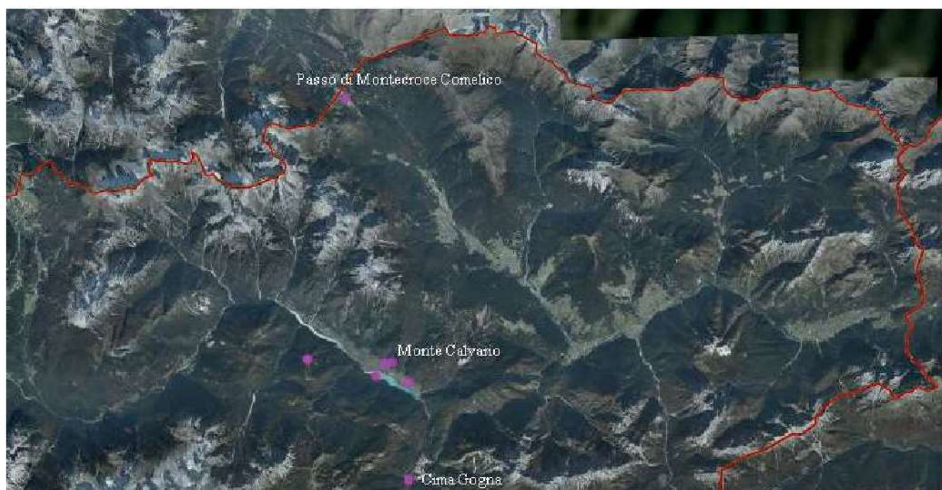
70. Siti romani in Comelico e nella Val d'Ansiei.