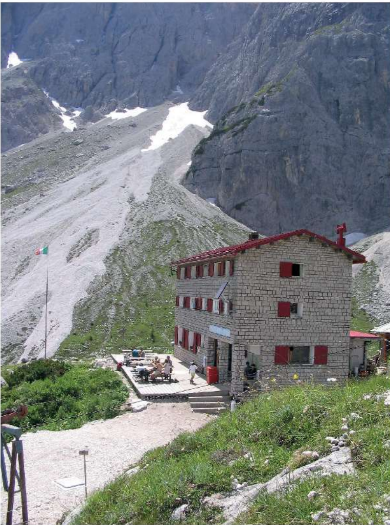
63. Vista del Rifugio Berti sul Popera.