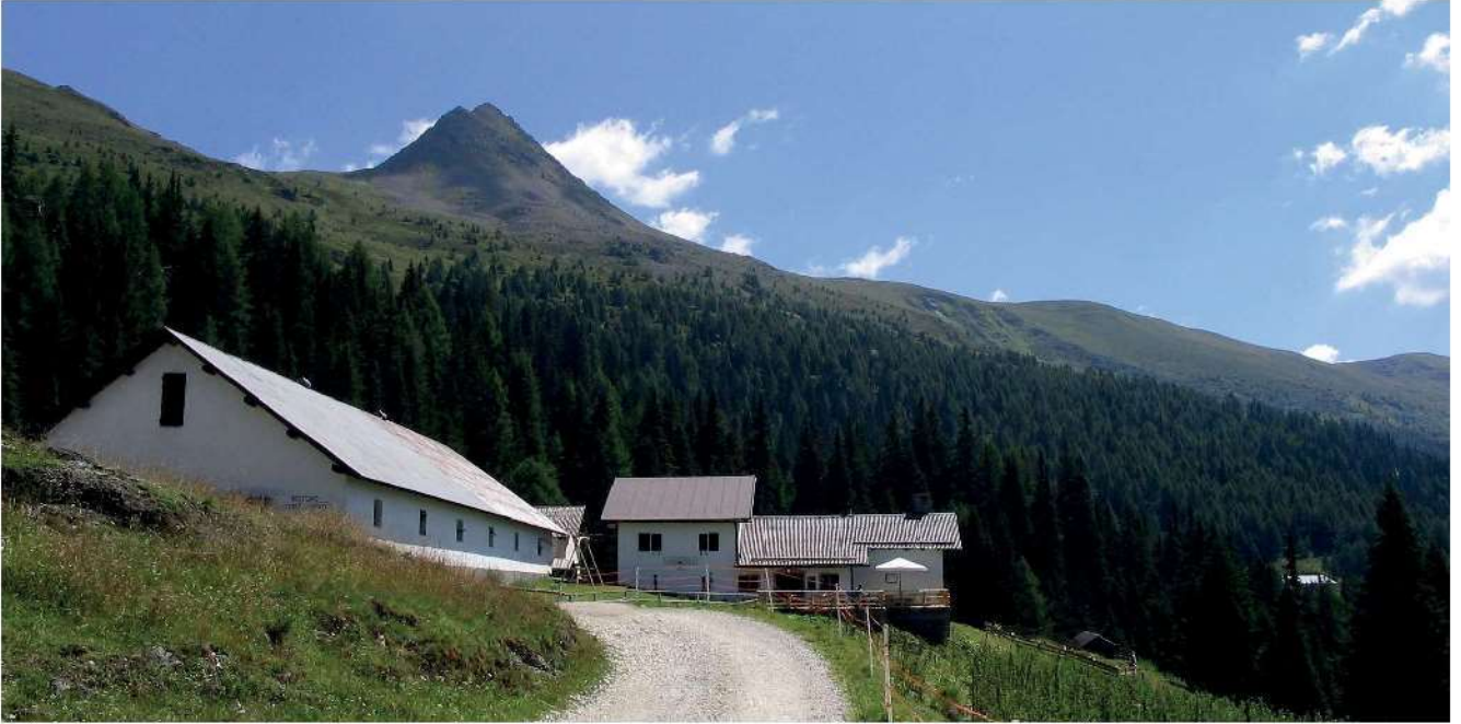
62. Malga Coltrondo con il Col Quaternà sullo sfondo.