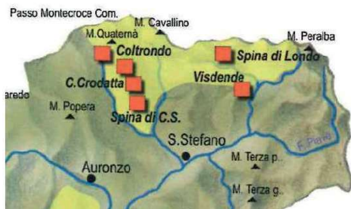
69. Siti mesolitici in Comelico. Immagine tratta da: P. Conte (a cura di), Belluno. Storia di una provincia dolomitica , vol. I, Udine 2013).