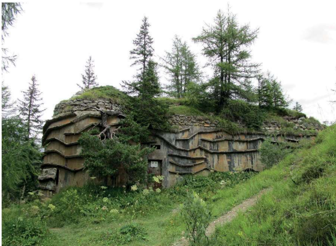
64. Fortificazione della II Guerra Mondiale nei pressi del Lago dell'Orso vicino al Passo di Monte Croce Comelico.