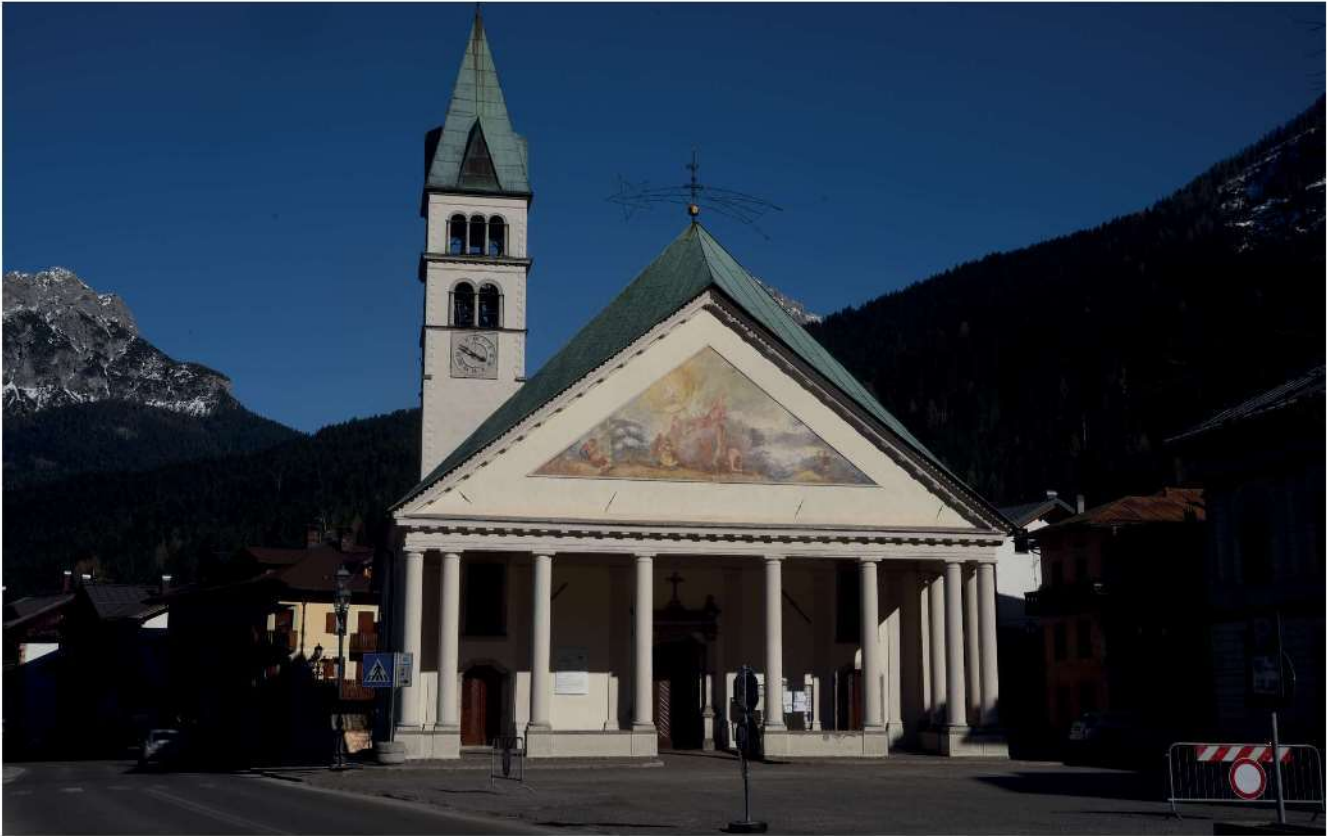
58. Chiesa di Santo Stefano, Santo Stefano di Cadore.