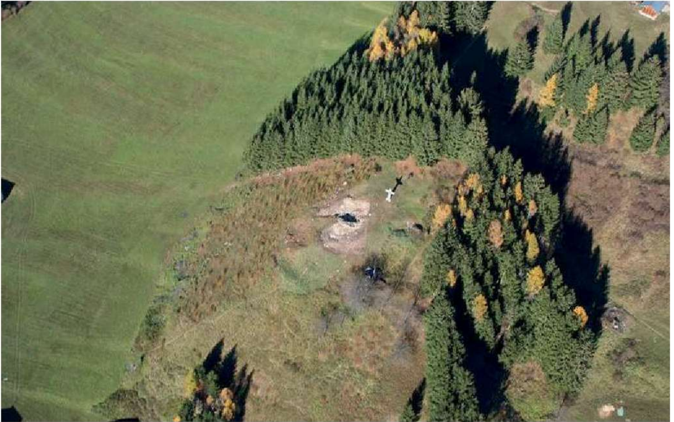
66. Vista aerea dell'area archeologica di Monte Calvario, Auronzo di Cadore.