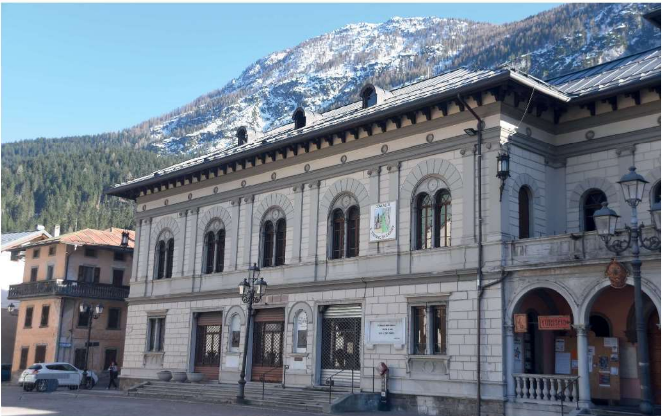
59. S. Stefano in Cadore, vista del Municipio.