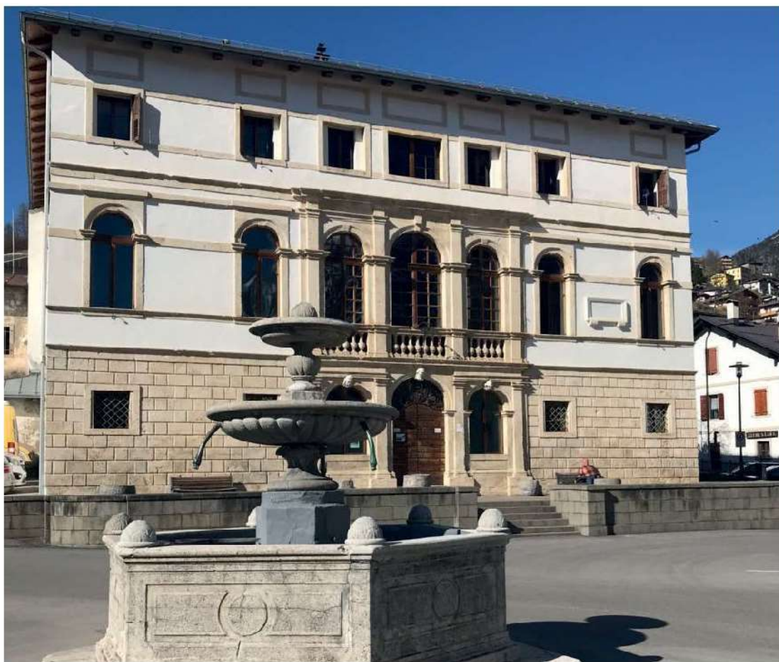
57. Villa Poli de Pol a S. Pietro In Cadore, fronte principale.