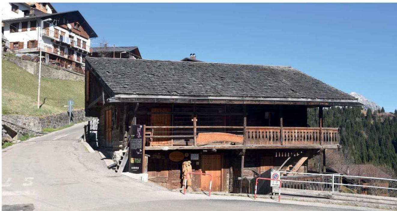
56. Esempio di edificio in legno pre-Rifabbrico, attualmente sede del museo Angiul Sai, a Costalta (S. Pietro in Cadore).