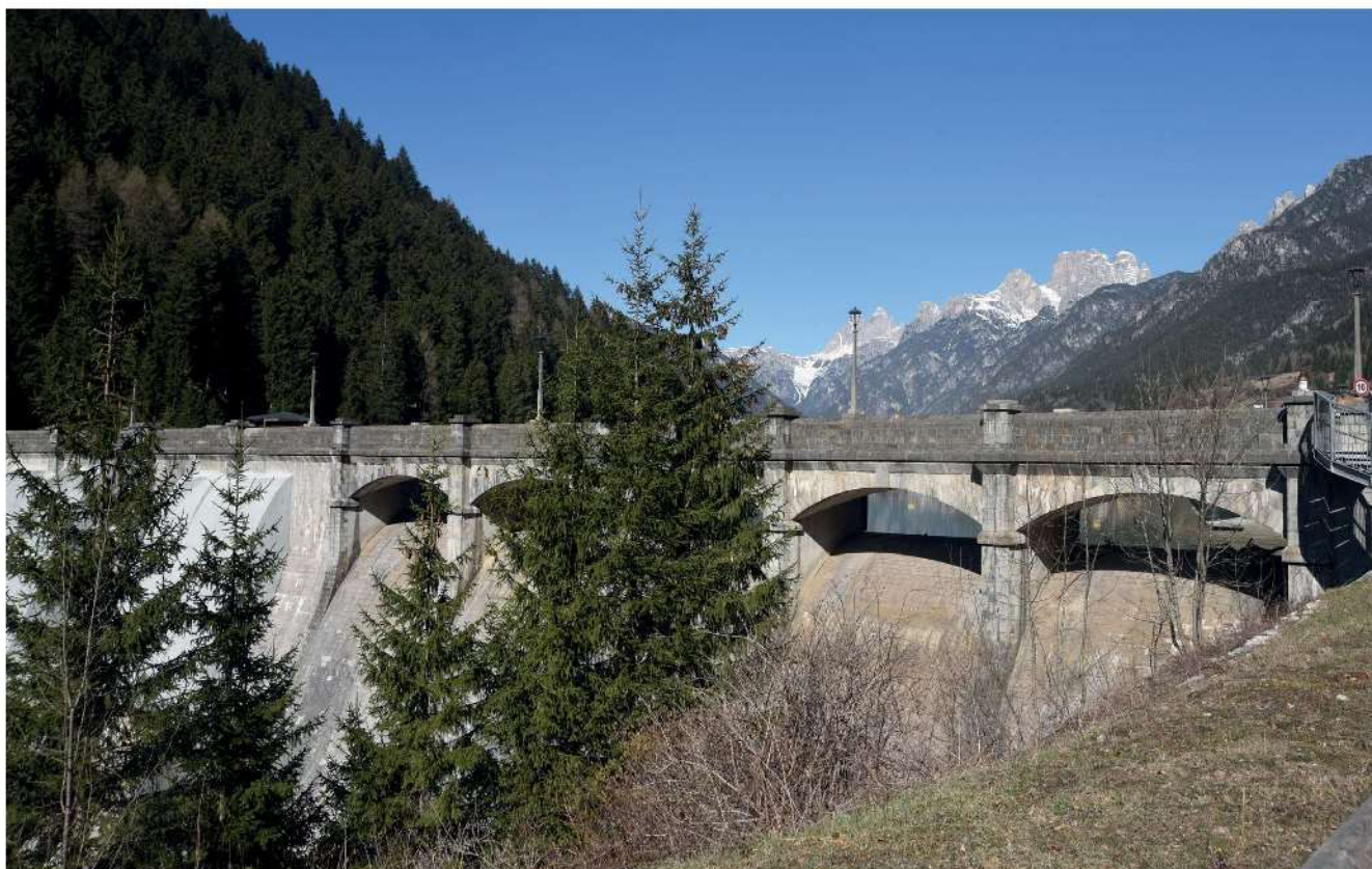
61. Diga di S. Caterina, Auronzo di Cadore.