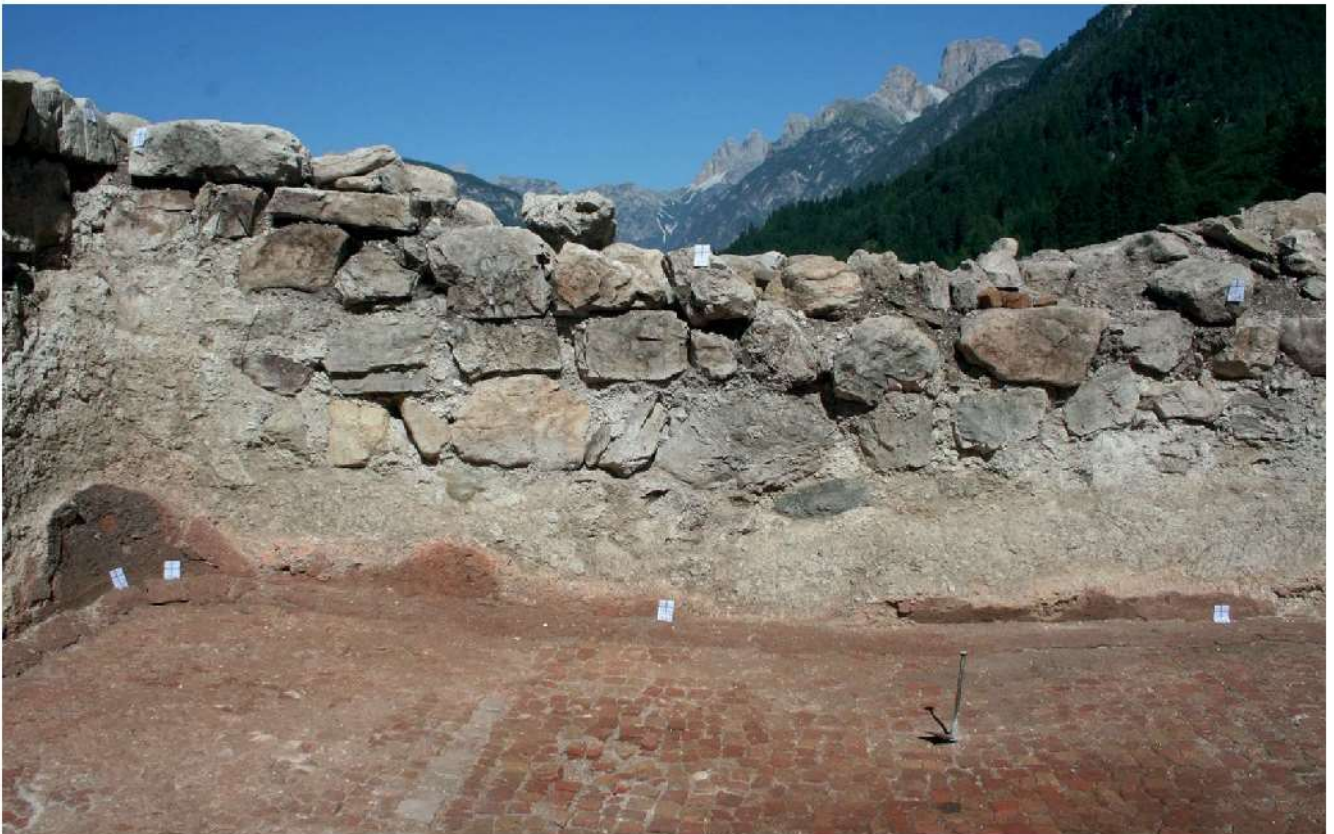
67. Vista del muro perimetrale ovest dell'area archeologica di Monte Calvario, Auronzo di Cadore.