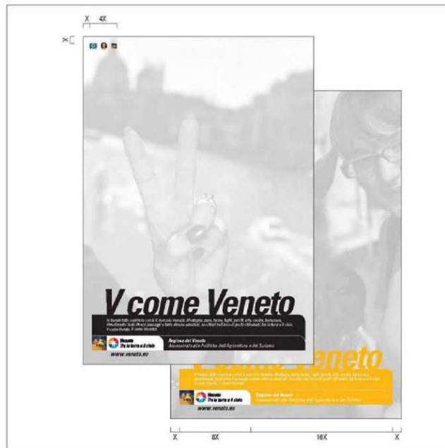
Esempio di applicazione logo turismo (dal Manuale d'uso del marchio turismo Veneto)