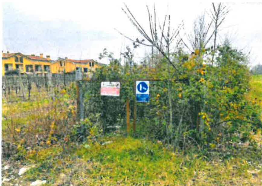
area ubicazione pozzo